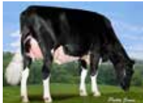
HANALEE ENFORCER CLARITY