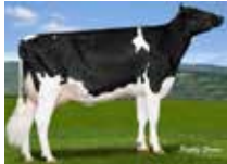
HAMMING ENFORCER DARIA