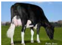
WALKERBRAE MERIDIAN LORETTA