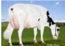
GILLETTE WALKHAVERN ASLEEP