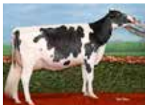
STEVAIN SALOON NOUKY