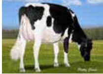
FINSIDE SALOON SERENA