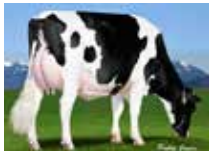
DOLPHIN SALOON 925