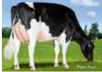
WALNUTLAWN ENFORCER SUZETTE