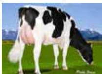
CEDARWAL MERIDIAN EBONY