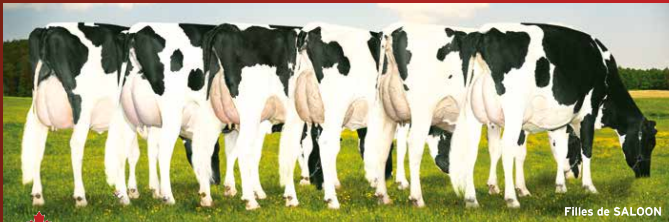
Filles de SALOON