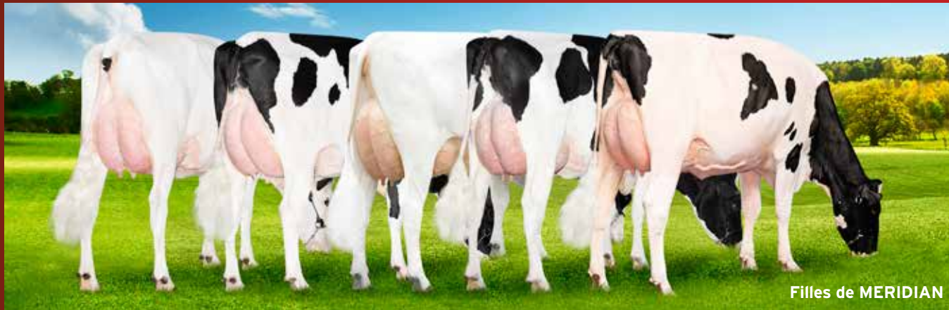
Filles de MERIDIAN