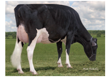
Cette fille américaine, Bur-Wal Buckeye Gigi, n'est pas encore classifiée, mais elle affiche la coupe franche et la merveilleuse qualité de pis de Buckeye.