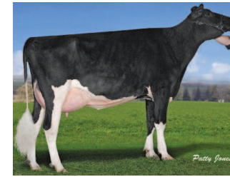
Gillette Buckeye SC Zip VG-86 est la Buckeye n° 2 au Canada et elle provient du coeur de la famille Gypsy.

Colin Dent trait 600 Holsteins au nord-ouest de l'Angleterre, où son troupeau - qui inclut de nombreuses familles internationales de vaches en vue, parvient à la moyenne de 9000kg. "Après avoir traité 15 filles de Buckeye en première lactation j'ai été extrêmement impressionné par leur volonté de produire et leur morphologie robuste. Ce sont